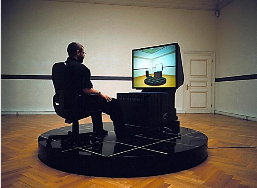
Jeffrey Shaw, Artiste Australien -1944 - Le musée virtuel, 1991, Installation numérique interactive, Collection du ZKM-Medienmuseum, Karlsruhe, Allemagne

Depuis les années 1990, l'impression de volume est donnée par des images en 3D. On pénètre et se déplace à l'intérieur de mondes étranges ou merveilleux totalement imaginaires. Ces mondes qui se confondent avec la réalité sont dits virtuels.