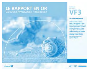
VF3 Exécution / Production / Réalisation