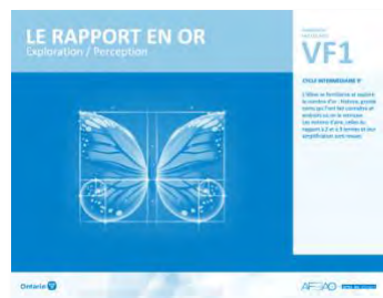
VF1 Exploration / Perception