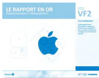
VF2 Expérimentation / Manipulation