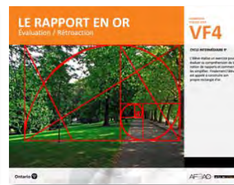
VF4 Évaluation / Rétroaction