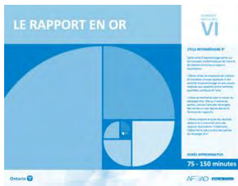
Version intégrale LE RAPPORT EN OR