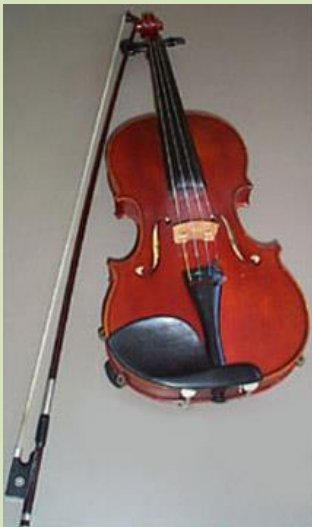
Le violon des Métis

http://firstpeoplesofcanada.com/fp_metis/fp_metis5.html