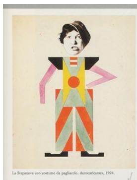
Varvava Stepanova Caricature , 1924, collage

Varvava Stepanova a créé des designs originaux de vêtements sport, des affiches et des costumes pour le théâtre. Avec son conjoint Alexander Rodchenko, Stepanova a créé l'œuvre intitulée Книги (Livres!) . L'affiche aux formes simples, au plan très géométrique et aux couleurs en aplat, a servi à promouvoir l'éducation des ouvriers soviétiques.