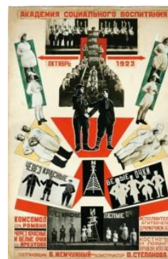
Varvara Stepanova, Through Red and White Glasses , collage affiche, 1924 http://www.tate.org.uk/context-comment/articles/short-life-equal-woman