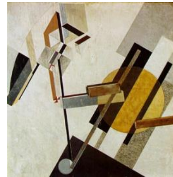
El Lissitzky, Proun 19D , 1922, collage, bois, huile http://www.wikiart.org/fr/el-lissitzky/proun-19d-1922