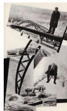
Alexander Rodchenko, Sans titre , 1923, photomontage, environ 10x 13 cm

http://fr.wahooart.com/@/8XXMRF-Alexander-Rodchenko-Composition