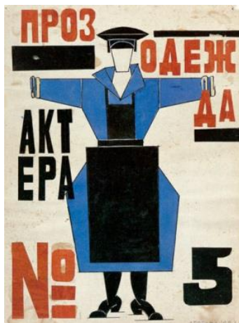
Liubov Popova, Production Clothing for Actor no.5 in Fernand Crommelynck's play The magnanimous Cuckold , 1921, collage, gouache et encre

http://uploads0.wikiart.org/images/liubov-popova/production-clothing-for-actor-no-5-in-fernand-crommelynck-s-play-the-magnanimous-cuckold.jpg