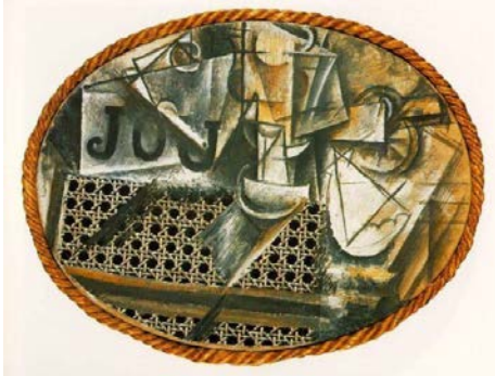
Nature morte à la chaise cannée , 1912, Peinture à l'huile, toile cirée, carte et corde sur toile. 29 x 37 cm

http://ekladata.com/AYyrdrlS0rSAtUsc1Pls6CODI-U.jpg