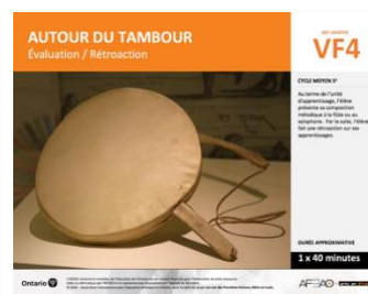
VF4 Évaluation / Rétroaction