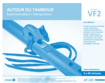
VF2 Expérimentation / Manipulation