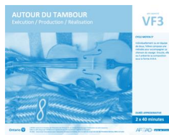
VF3 Exécution / Production / Réalisation