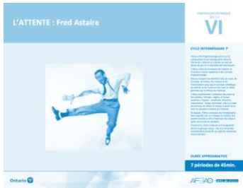
Version intégrale L'ATTENTE : Fred Astaire