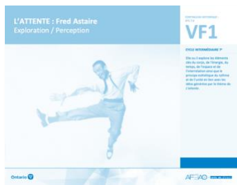
VF1 Exploration / Perception