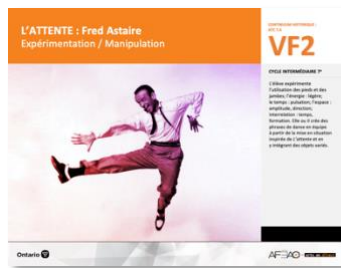
VF2 Expérimentation / Manipulation