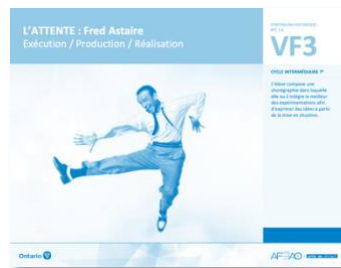
VF3 Exécution / Production / Réalisation