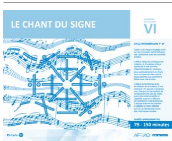
Version intégrale LE CHANT DU SIGNE