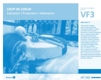
VF3 Exécution / Production / Réalisation