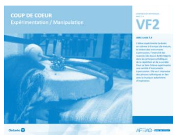
VF2 Expérimentation / Manipulation