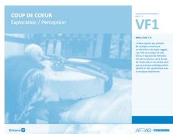
VF1 Exploration / Perception