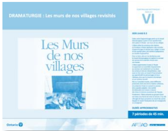
Version intégrale DRAMATURGIE : Les murs de nos villages revisités