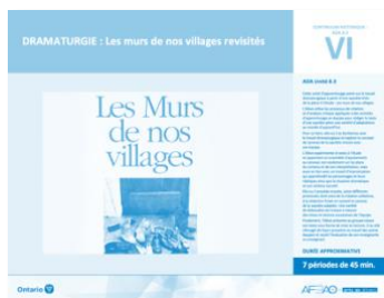
Version intégrale DRAMATURGIE : Les murs de nos villages revisités