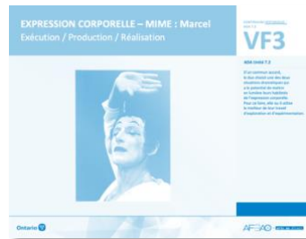
VF3 Exécution / Production / Réalisation