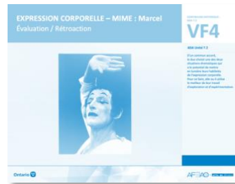
VF4 Évaluation / Rétroaction