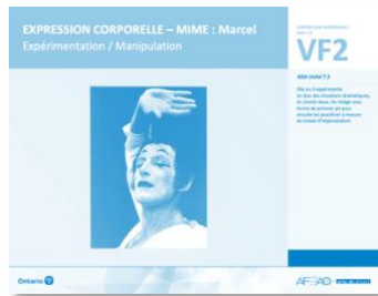
VF2 Expérimentation / Manipulation