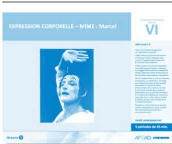
Version intégrale EXPRESSION CORPORELLE – MIME : Marcel Marceau