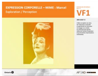
VF1 Exploration / Perception