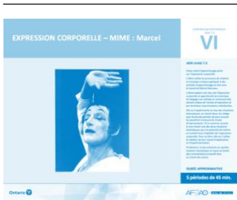
Version intégrale EXPRESSION CORPORELLE – MIME : Marcel Marceau