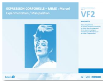
VF2 Expérimentation / Manipulation