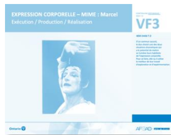
VF3 Exécution / Production / Réalisation