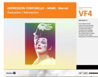
VF4 Évaluation / Rétroaction