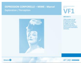
VF1 Exploration / Perception