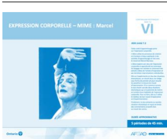
Version intégrale EXPRESSION CORPORELLE – MIME : Marcel Marceau