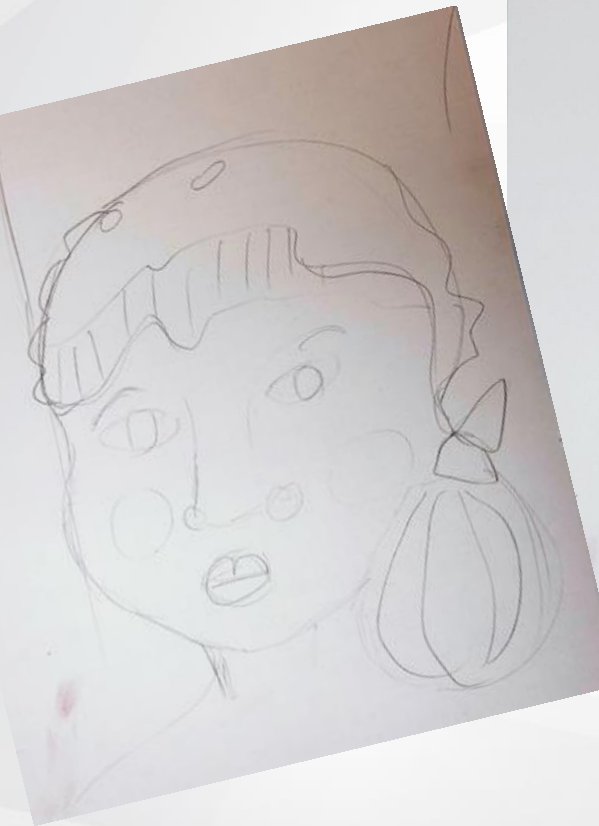
La diapositive imprimée