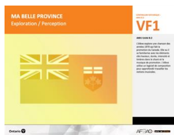
VF1 Exploration / Perception