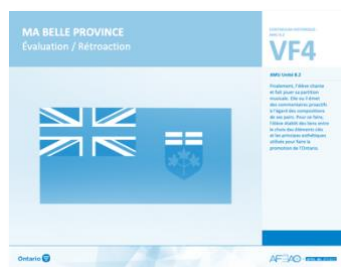
VF4 Évaluation / Rétroaction