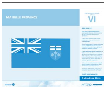
Version intégrale MA BELLE PROVINCE