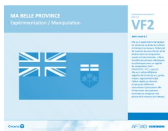
VF2 Expérimentation / Manipulation