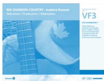
VF3 Exécution / Production / Réalisation