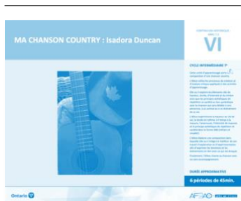
Version intégrale MA CHANSON COUNTRY