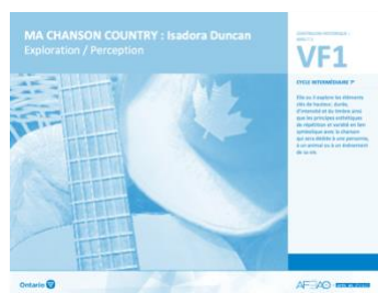
VF1 Exploration / Perception