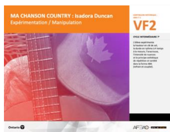
VF2 Expérimentation / Manipulation