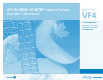
VF4 Évaluation / Rétroaction