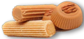
Les bonbons au lait