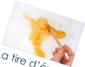
La tire d'érable