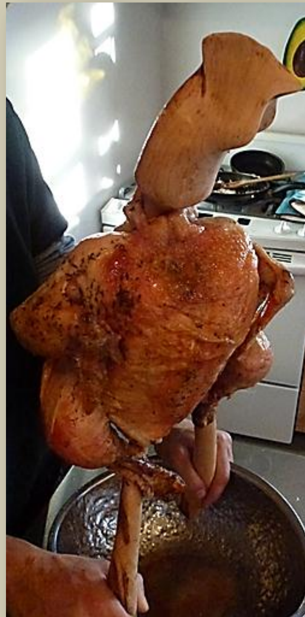
Cul de poule , 2013, Bois d'érable, laiton et bol en acier inoxydable récupéré, 50 cm

Œuvre réalisée pour la Table agroalimentaire de l'Outaouais dans le cadre du projet L'Art prend la clef des champs