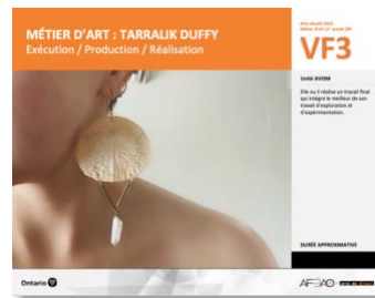
VF3 Exécution / Production / Réalisation