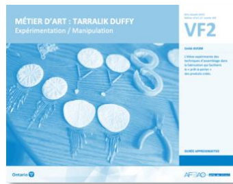
VF2 Expérimentation / Manipulation