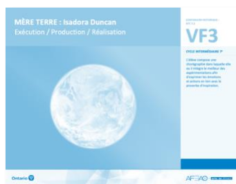
VF3 Exécution / Production / Réalisation