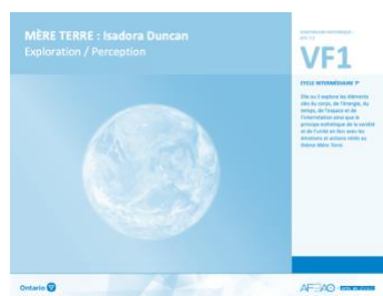
VF1 Exploration / Perception