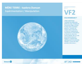
VF2 Expérimentation / Manipulation