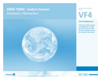
VF4 Évaluation / Rétroaction