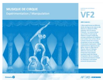
VF2 Expérimentation / Manipulation