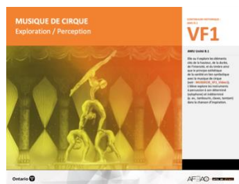
VF1 Exploration / Perception