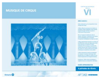
Version intégrale MUSIQUE DE CIRQUE