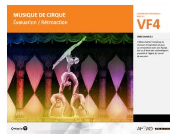
VF4 Évaluation / Rétroaction