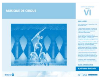
Version intégrale MUSIQUE DE CIRQUE