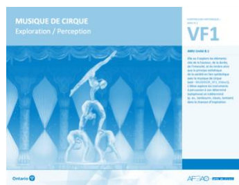
VF1 Exploration / Perception