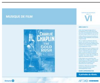
Version intégrale MUSIQUE DE FILM