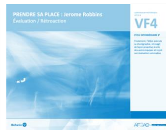
VF4 Évaluation / Rétroaction