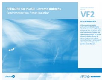
VF2 Expérimentation / Manipulation