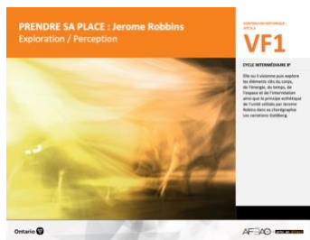
VF1 Exploration / Perception