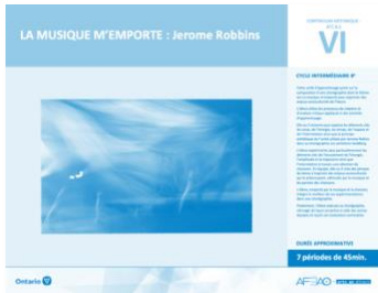
Version intégrale LA MUSIQUE M'EMPORTE : Jerome Robbins