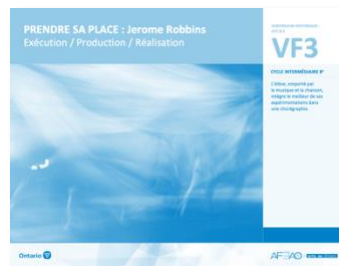
VF3 Exécution / Production / Réalisation