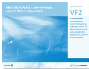
VF2 Expérimentation / Manipulation