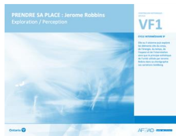
VF1 Exploration / Perception