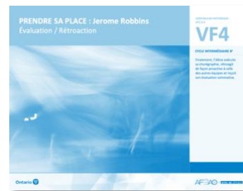
VF4 Évaluation / Rétroaction