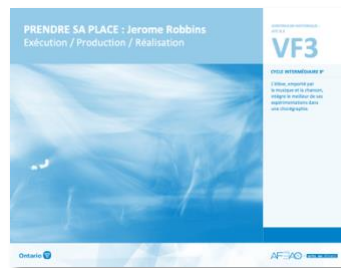
VF3 Exécution / Production / Réalisation