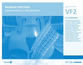
VF2 Expérimentation / Manipulation