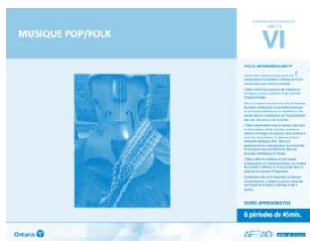
Version intégrale MUSIQUE POP/FOLK