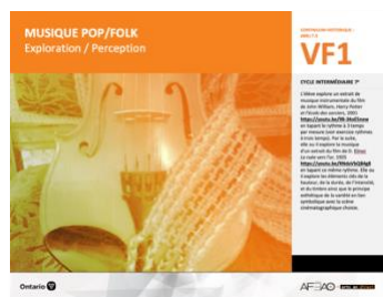
VF1 Exploration / Perception