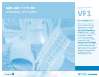
VF1 Exploration / Perception