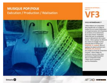
VF3 Exécution / Production / Réalisation