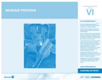
Version intégrale MUSIQUE POP/FOLK