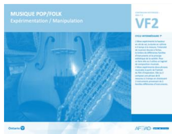
VF2 Expérimentation / Manipulation