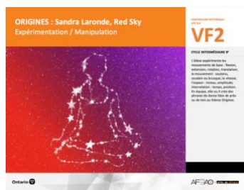
VF2 Expérimentation / Manipulation