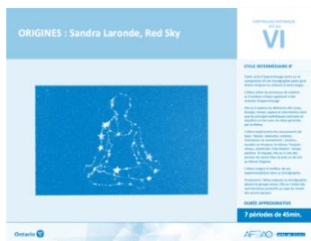
Version intégrale ORIGINES : Sandra Laronde, Red Sky