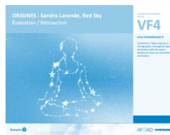
VF4 Évaluation / Rétroaction