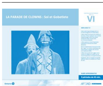
Version intégrale LA PARADE DE CLOWNS : Sol et Gobelet