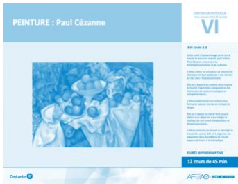
Version intégrale PEINTURE : Paul Cézanne