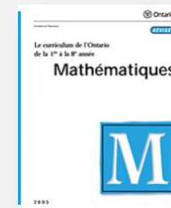
Mathématiques 7 e : A3.6 8 e : A3.6