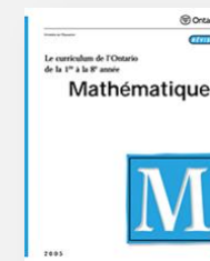
Mathématiques 7 e : A3.6 8 e : A3.6