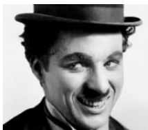
Charlie Chaplin (1889-1977)

Fais une courte recherche sur ces deux artistes de la scène par rapport à leur tenue vestimentaire : pourquoi est-elle si différente bien qu'ils ont tous les deux pratiqué le métier de mime?