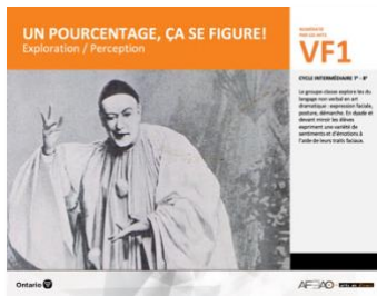
VF1 Exploration / Perception