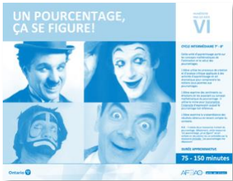
Version intégrale UN POURCENTAGE, ÇA SE FIGURE!