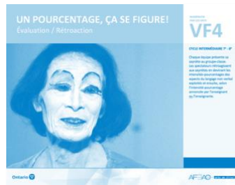
VF4 Évaluation / Rétroaction