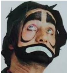
Marc Favreau (1929-2005)

Comment le langage non verbal est-il exploité dans la photo de chacun de ces artistes de la scène?