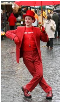
Pablo Zibes (1971- )

Métier : Humoriste et comédien d'origine québécoise