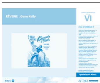
Version intégrale RÊVERIE : Gene Kelly