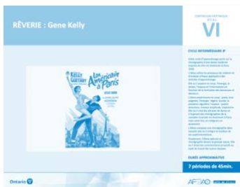
Version intégrale RÊVERIE : Gene Kelly