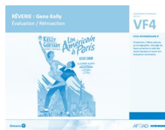
VF4 Évaluation / Rétroaction