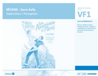
VF1 Exploration / Perception