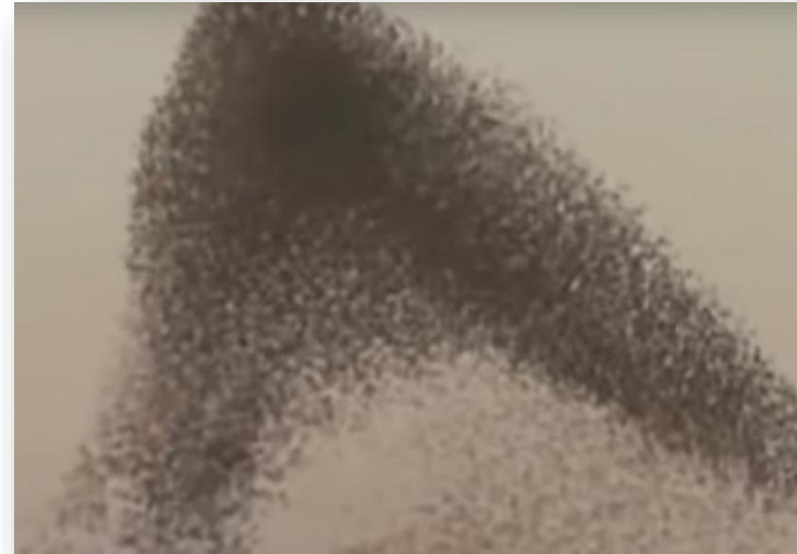
Vidéo de Philippe Lavaux

La forme en premier plan semble s'étirer dans l'espace. Les couleurs variées des morceaux de mosaïque donnent l'idée d'un mouvement, sur le fond, dont les couleurs font penser à une photo vue d'avion: la mer et la terre.