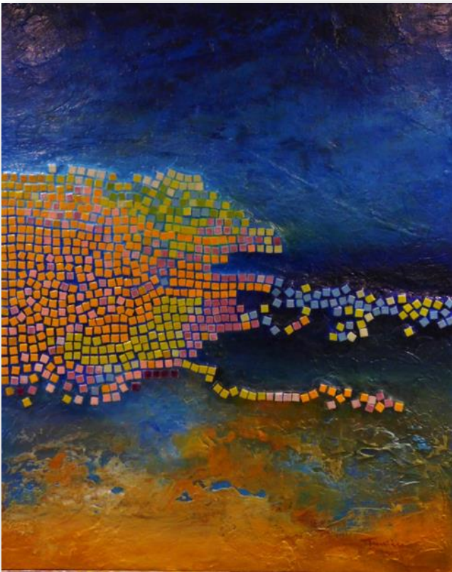
Œuvre de Frenière

La forme en premier plan semble s'étirer dans l'espace. Les couleurs variées des morceaux de mosaïque donnent l'idée d'un mouvement, sur le fond, dont les couleurs font penser à une photo vue d'avion: la mer et la terre.