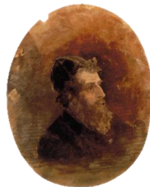
Le Juif riche