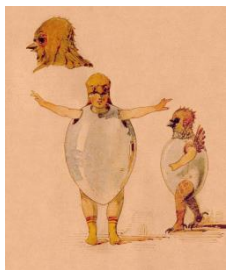
Esquisse pour le ballet Trilby

Ci-dessous, œuvres de Viktor Hartmann , ami du compositeur, qui ont influencé ses compositions.