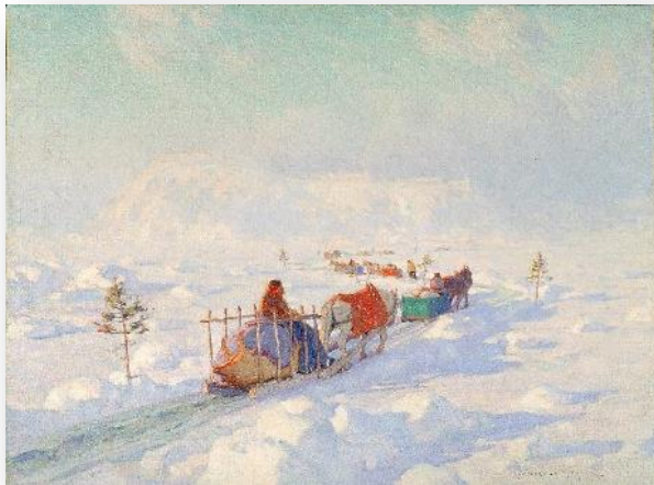
Le pont de glace à Québec, de Clarence Gagnon

Es-tu surpris de trouver un canard sur un balcon à Toronto? Le canard vit dans la nature, le calme. Les sons ne sont pas les mêmes que dans les rues de Toronto. Recherche, dans Internet, une scène de la nature, de plantes, de poissons, d'arbres... Ou comme ici un tableau représentant un paysage canadien .