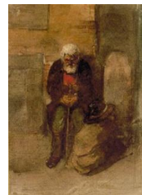
Le Juif pauvre