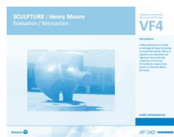
VF4 Évaluation / Rétroaction