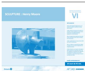
Version intégrale SCULPTURE : Henry Moore