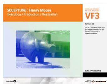
VF3 Exécution / Production / Réalisation