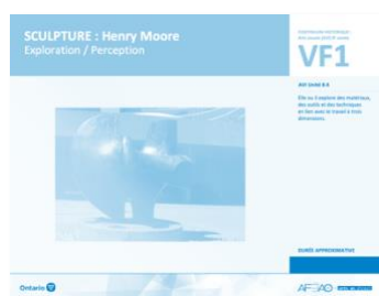
VF1 Exploration / Perception