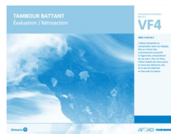
VF4 Évaluation / Rétroaction