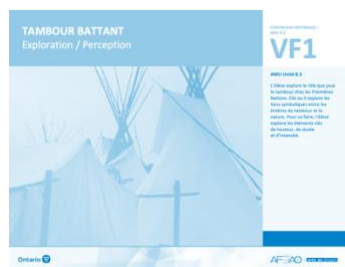
VF1 Exploration / Perception