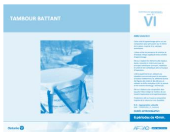
Version intégrale TAMBOUR BATTANT