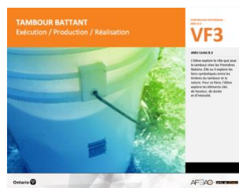
VF3 Exécution / Production / Réalisation