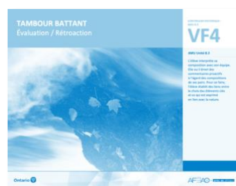
VF4 Évaluation / Rétroaction