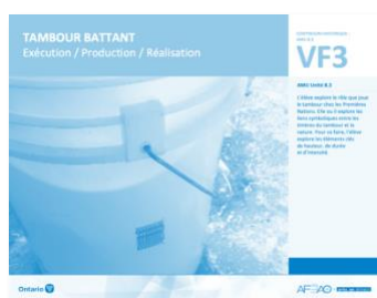
VF3 Exécution / Production / Réalisation