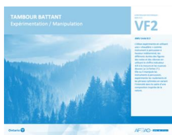
VF2 Expérimentation / Manipulation