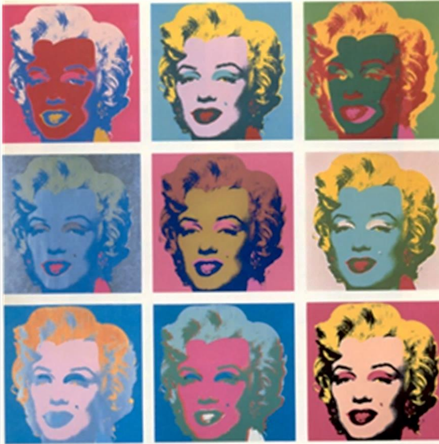
WARHOL, Marilyn, 1967, sérigraphie en couleurs , 91,4 x 91,4 cm