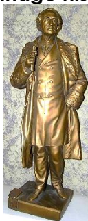
Sir John A. Macdonald , de Louis-Philippe Hébert