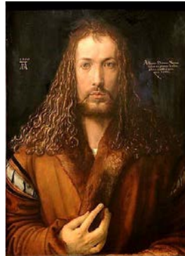
Autoportrait à la fourrure , d'Albrecht Dürer