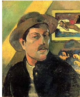
Autoportrait au chapeau , de Paul Gauguin