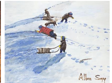
S'amuser avec ses amis (Having Fun With Friends) d'Allen Sapp