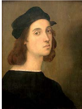
Autoportrait , de Raphaël