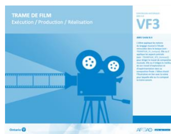
VF3 Exécution / Production / Réalisation