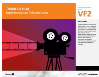
VF2 Expérimentation / Manipulation