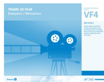
VF4 Évaluation / Rétroaction