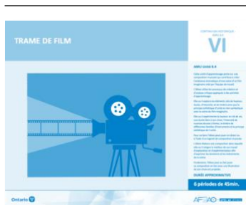
Version intégrale TRAME DE FILM