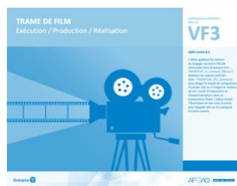
VF3 Exécution / Production / Réalisation