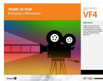
VF4 Évaluation / Rétroaction