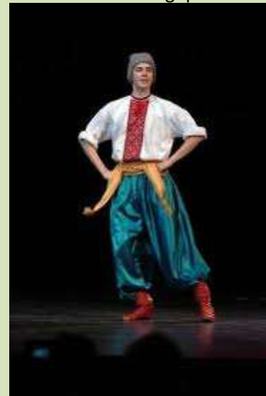
Danseur de gopak