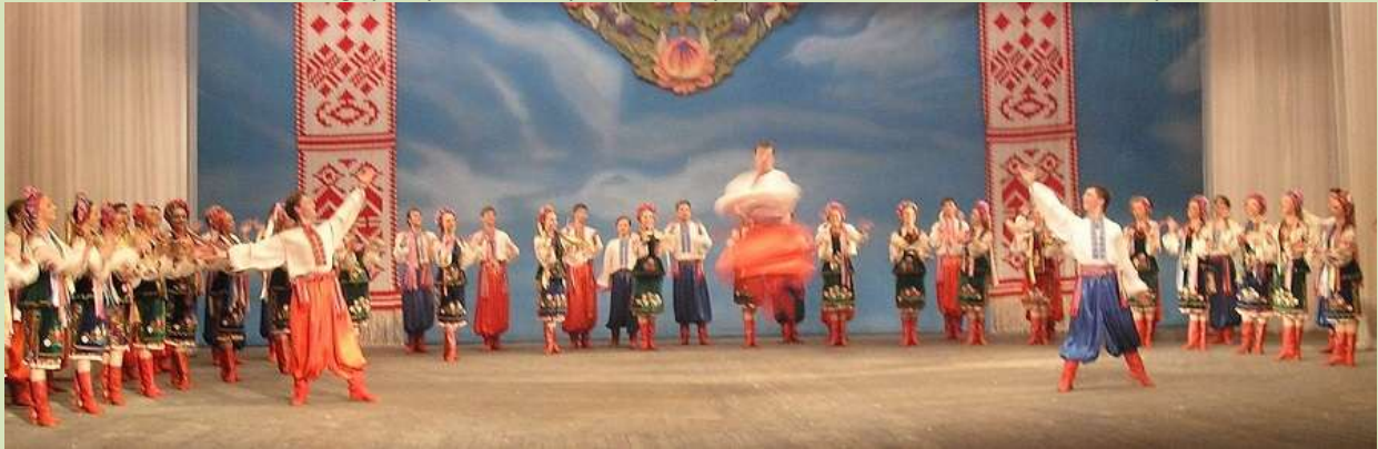
La danse gopak par la Troupe folklorique nationale ukrainienne P. Virsky