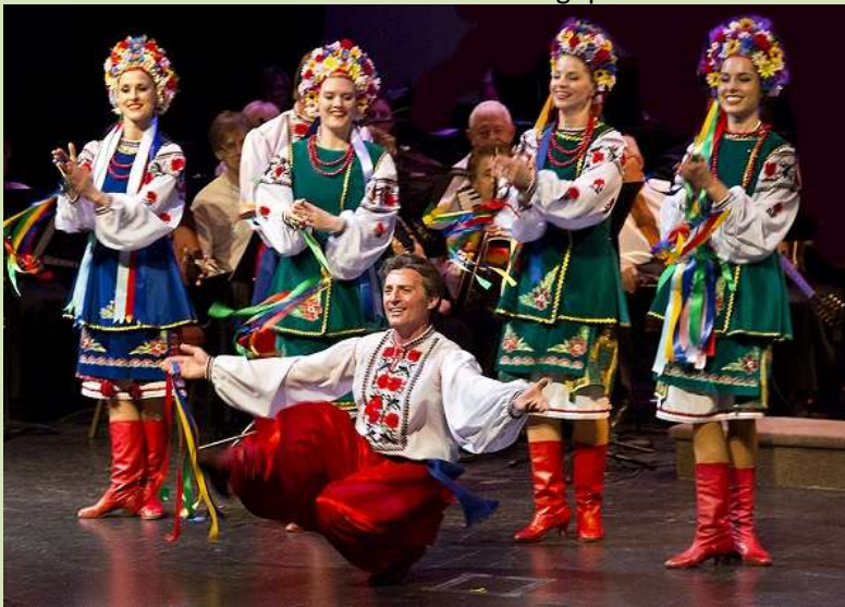
Danseuses et danseur de gopak

Les femmes portent également des bottes ou des souliers, une blouse décorée de broderies et une plakhta , une jupe tissée de couleurs vives et agrémentée de dessins géométriques et autres. Elles portent une couronne de fleurs et de rubans.