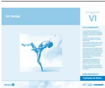
Version intégrale UN TEMPS : José Limon